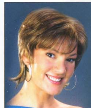
Heather 590 €*