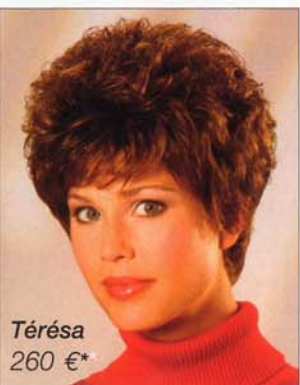
Térésa 260 €*