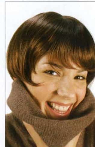
Sunflower 576 €*