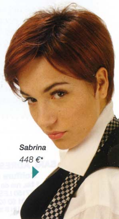
Sabrina 448 €*